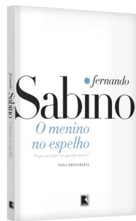
3º Tri.: O menino no espelho.