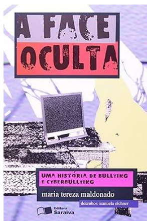
1º Tri: Fase Oculta